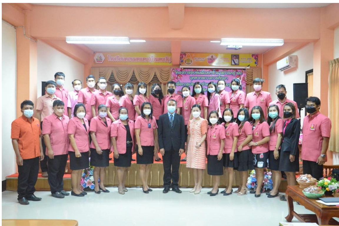
โครงการอบรมพัฒนาข้าราชการครูและบุคลากรทางการศึกษา เพื่อการประเมินตำแหน่งและวิทยฐานะตามหลักเกณฑ์ วPA ณ ห้องประชุมโรงเรียนดอนมดแดง(บ้านดงบัง)